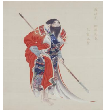
『御味方蝦夷之図』〔イコトイ〕