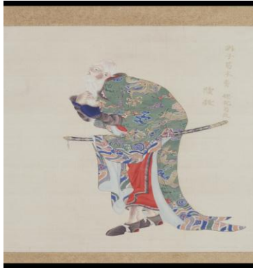
『御味方蝦夷之図』〔ジョンコ〕