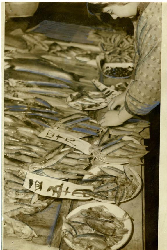
ドンと入荷して安値で出回り始めた走りの夏イカ (昭和 37 年 5 月) ph006165

函館の初夏の味覚といえば新鮮なイカですが、昭和 37 年当時は一皿 50 円で売っていたんですね。子どもの頃に食べた、朝とれたばかりのイカの刺身の美味しさは特別でした。