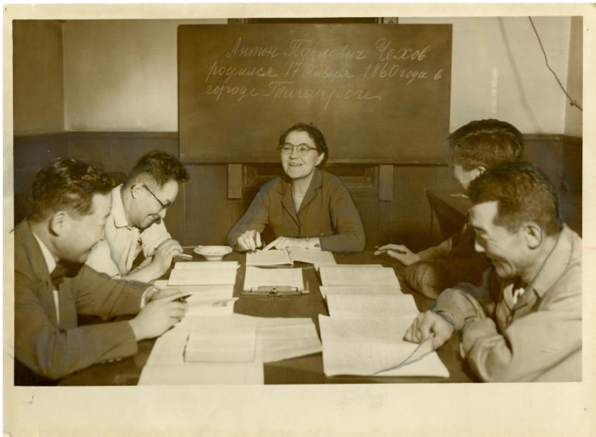
五輪控え高まる語学熱 (ph003698)

2年後に東京オリンピックを控え、函館でも語学レッスンが盛んにおこなわれていたそうです。写真は函館図書館分館に集まるロシア語研究会の様子。英語のクラスは受付開始後すぐに満員になる、と当時の新聞が伝えています。