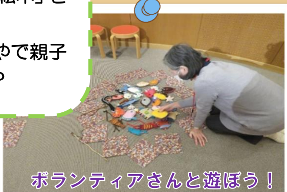
ボランティアさんと遊ぼう!

毎週日曜日は図書館ボランティアさんが「おはなしのへや」に来て、いつもは見る事ができない「布おもちゃ」や「しかけ絵本」を公開しています! ボランティアさんとおへやで親子一緒に遊んでみませんか?