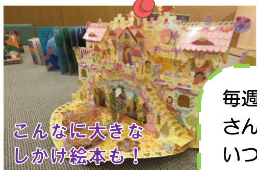
こんなに大きな しかけ絵本も!