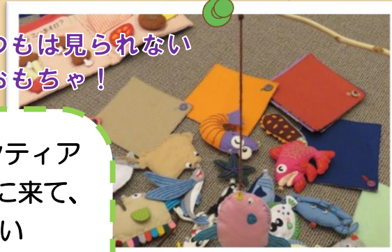
いつもは見られない 布おもちゃ!

毎週日曜日は図書館ボランティアさんが「おはなしのへや」に来て、いつもは見る事ができない「布おもちゃ」や「しかけ絵本」を公開しています! ボランティアさんとおへやで親子一緒に遊んでみませんか?