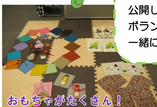
おもちゃがたくさん!