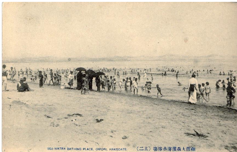
函館大森浜海水浴場 (其二) SEA-WATER BATHING PLACE, OMORI, HAKODATE. (pc000501)